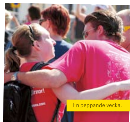
En peppande vecka.

Riksteaterns Open Sign www.riksteatern.se