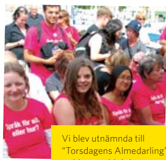
Vi blev utnämnda till "Torsdagens Almedarling" av bloggen Maktthavare.se