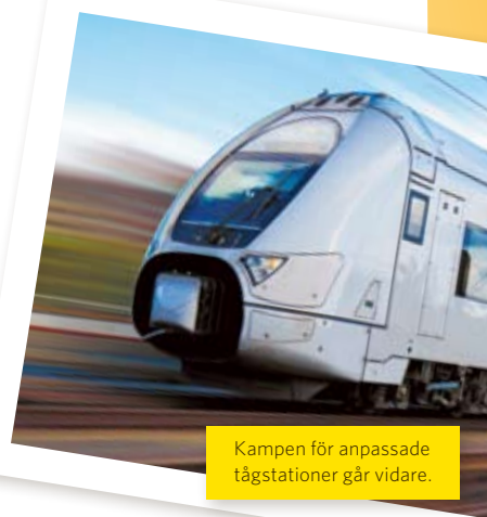
Kampen för anpassade tågstationer går vidare.

Under hösten hoppas vi kunna träffa tågoperatörerna för att diskutera hur de kan förbättra tillgängligheten för unga med hörselskada på tågen. Vi fortsätter att kämpa för ökad tillgänglighet. ■