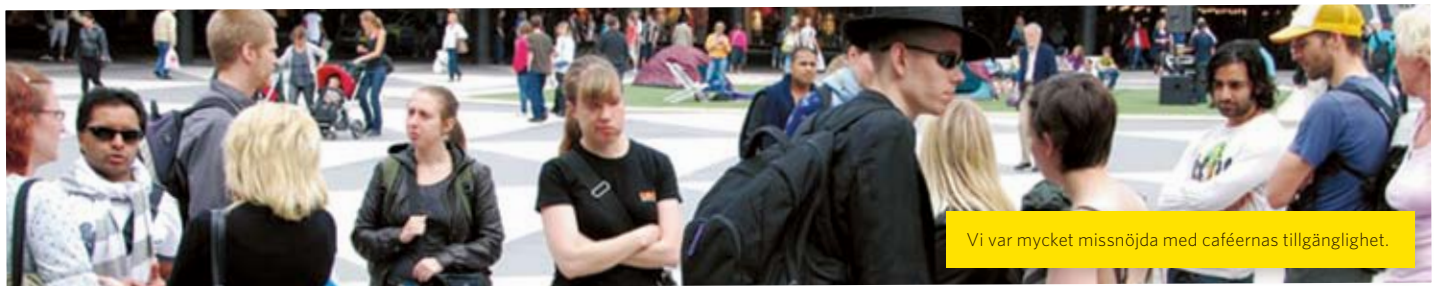
Vi var mycket missnöjda med caféernas tillgänglighet.

Vi som var ledare tackar för en jätterolig helg med mycket skratt.